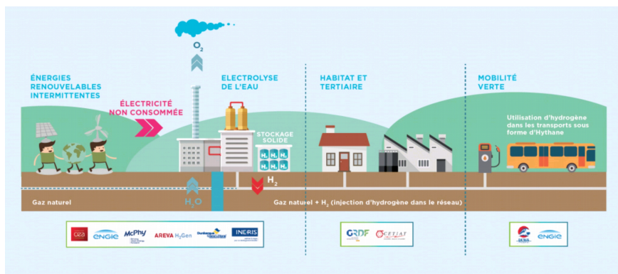
Schéma du démonstrateur GRHYD à Dunkerque

A terme, l'hydrogène vert pourra être produit à grande échelle, par électrolyse, à coût compétitif dans certaines zones du monde. Cet hydrogène pourra ensuite être utilisé pour répondre à des besoins locaux mais pourra également être exporté vers d'autres zones qui seront en déficit d'énergie renouvelable par rapport à leurs besoins.